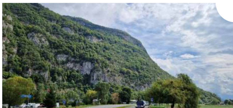
Cette zone particulièrement exposée devrait enfin pouvoir être sécurisée.

Face aux risques accrus de chutes de blocs, d'éboulements et d'inondations, le secteur « Sous Châble Rouge – Pré de l'Oie » entre Yvorne et Versvey doit être équipé pour écarter tout nouveau danger et sécuriser une zone sensible et exposée, entre les campings du Clos de la George, celui de la Roseraie, les halles de la zone artisanale et la route cantonale. En 2019 déjà, différents bureaux d'ingénieurs se sont penchés sur la