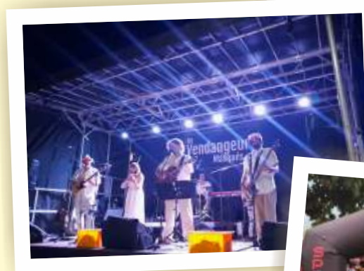
Les Vendangeurs Masqués ont mis l'ambiance samedi soir.