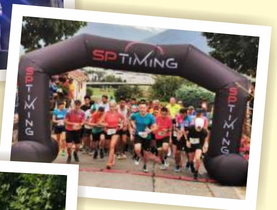
La journée de dimanche a été marquée par la Vuarnérune (ici le départ de la boucle de 8km).