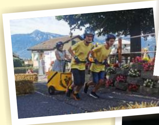
Parmi les nombreuses activités ludiques et sportives proposées tout au long du week-end, le parcours d'obstacles en char a fait le bonheur des petits et des grands.