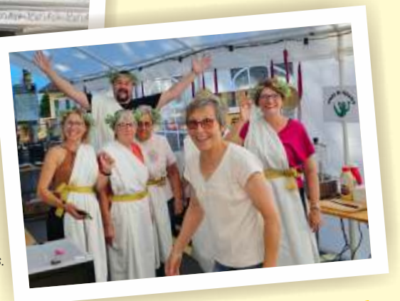
Les sourires des sociétaires des Amis de Versvey et de la Chanson des Resses.