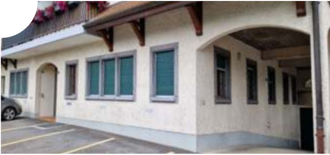
Les deux locaux vacants du bâtiment de la Souche seront prochainement adaptés pour accueillir une Unité d'Accueil pour Ecoliers.

C'est une nouvelle réjouissante pour les parents et élèves de primaire de notre commune : la création d'une Unité d'Accueil pour Ecoliers (UAPE) s'accélère. Le 12 septembre dernier, le Conseil communal a accepté un crédit d'étude pour transformer les locaux commerciaux du rez-de-chaussée du bâtiment de la Souche en UAPE.