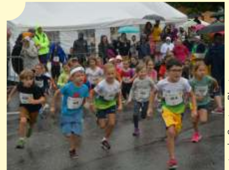
Les Minis (2017 et +) s'élançant tambour battant pour un peu plus de 2 minutes de course.