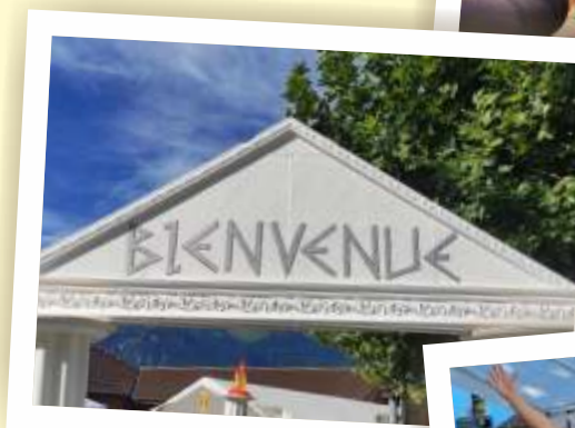
Yvorne s'est donnée des allures de Grèce antique le temps d'un week-end.