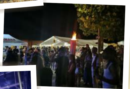
La flamme olympique a brillé pendant toute la fête