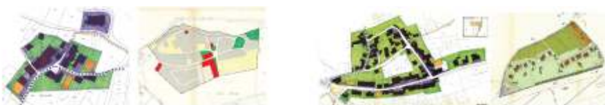
19 plans spéciaux et leurs réglementations respectives, établis entre 1974 et 2018, sont toujours en vigueur. Une simplification est prévue dans le futur PACom.

Il est encore prématuré d'estimer une date d'entrée en vigueur de cet outil stratégique de référence pour l'aménagement de notre commune.