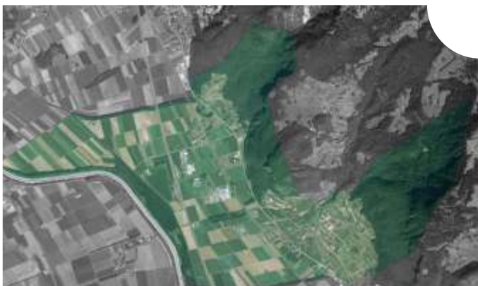
La révision du PACom a pour but définir une stratégie d'aménagement globale conforme aux défis actuels et futurs.

Essentiel dans l'aménagement du territoire d'une commune, le plan d'affectation communal (PACom) en détermine l'affectation des différentes zones et du sol et définit des règles constructives. En vigueur depuis 1994, il fait l'objet d'une révision nécessaire pour répondre aux futurs enjeux régionaux et cantonaux et se mettre en conformité avec les nouvelles législations fédérales et cantonales. Initiée en 2008 déjà, la démarche s'avère longue et fastidieuse.