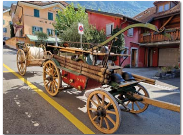
L'équipe invitée de Palézieux a fait le déplacement avec sa « Thiolleyres » de 1922 pour une démonstration.