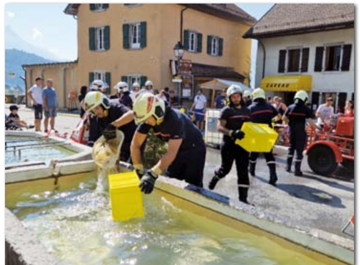
Réalimentation en eau avec les moyens du bord.