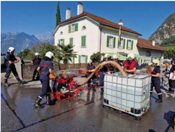
Adaptation et réactivité tout au long d'un parcours semé d'embûches.

C'est en 1990 que les cadres des sapeurs-pompiers du Chablais vaudois et valaisan ont eu l'idée d'organiser une rencontre amicale entre des équipes provenant de leur région. Ce « concours » s'est au fil des ans ouvert à diverses équipes invitées.