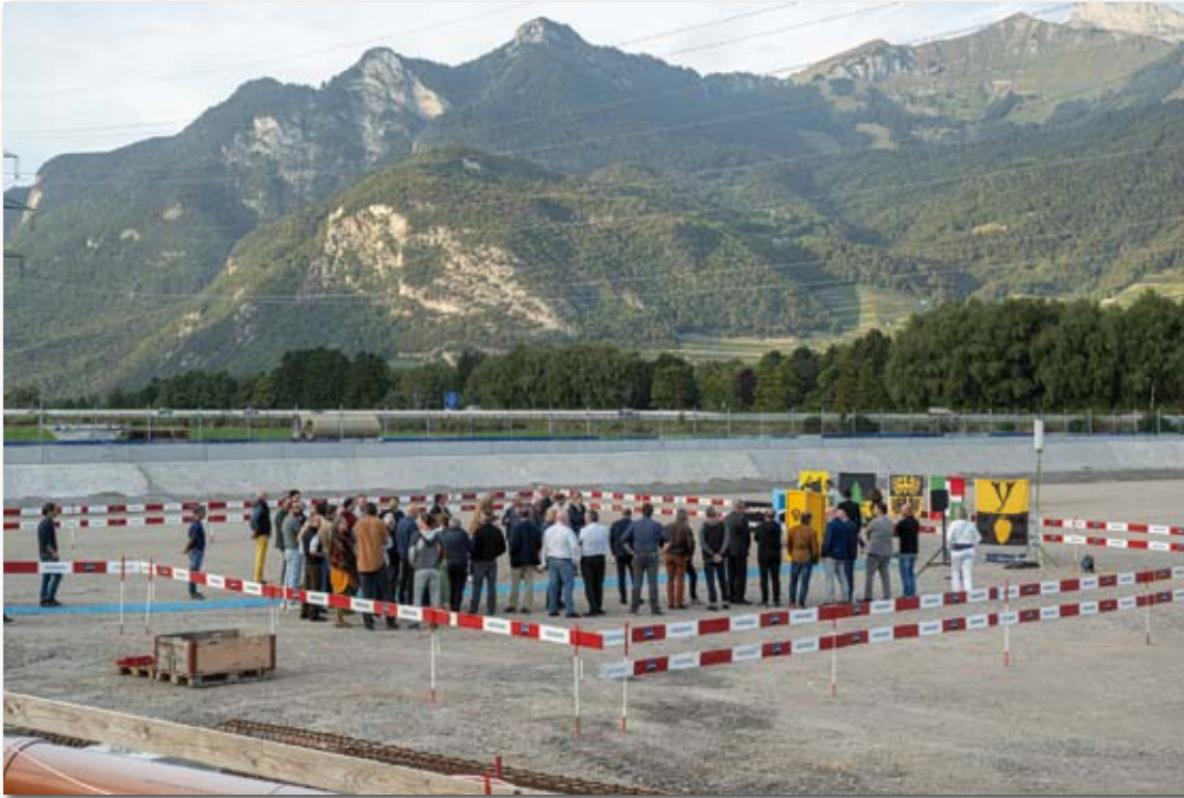
Le site actuel de la STEP d'Aigle fera place à la nouvelle STEP intercommunale - Crédit photo : ARC/J.-B. Sieber

Ce projet à 60 millions de francs, qui couvrira le traitement des eaux usées des 24'000 habitants actuels, plus ceux de l'industrie, de l'artisanat, du commerce présents sur le territoire des cinq communes, entre donc dans sa phase concrète. Il permettra de réaliser, à terme, des économies d'échelle au niveau des frais d'investissement et d'exploitation, et d'améliorer la qualité des eaux rejetées, notamment en stoppant les micropolluants et l'azote. Sur le plan énergétique, la valorisation d'une telle STEP se concrétisera par l'utilisation de panneaux photovoltaïques et la production de biogaz.