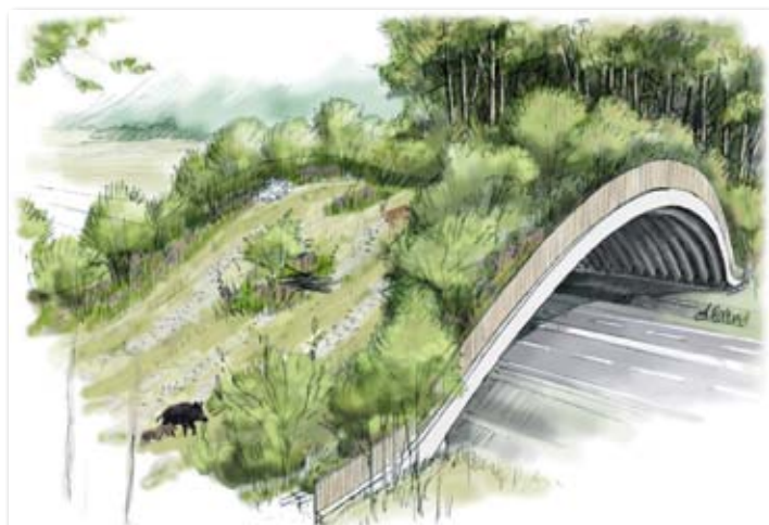
Esquisse de l'ouvrage faunistique

Le coût total de ce projet avoisine les 16,5 millions de francs. La commune d'Yverne n'est pas partie prenante.