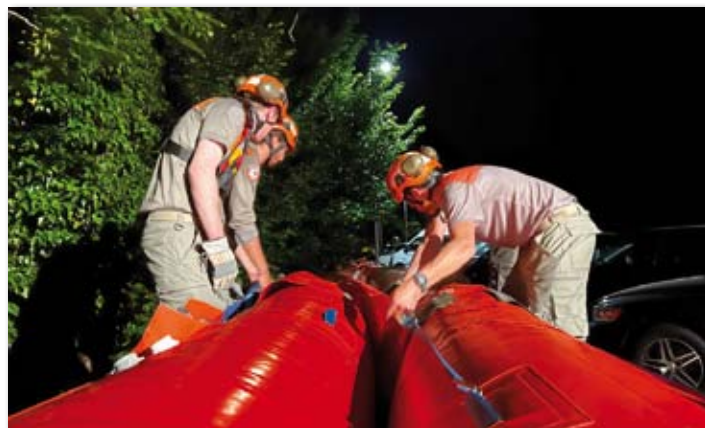
Les astreints ont testé le dispositif d'intervention en cas de crue

Pour en savoir plus : www.protectioncivile-vd.ch