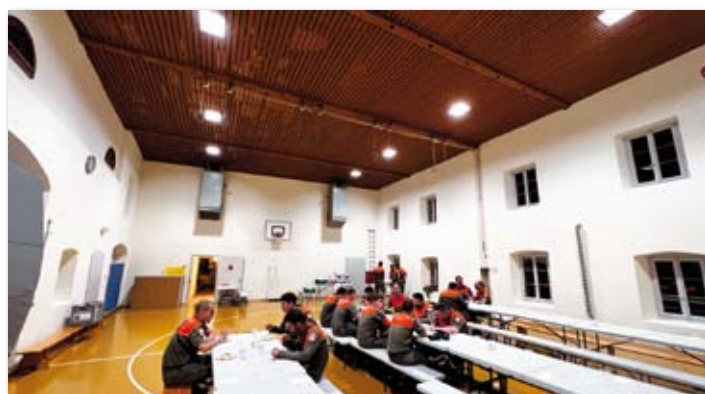
La salle de gym d'Yvorne a servi au ravitaillement des troupes