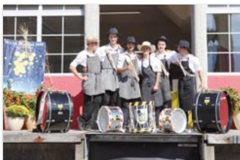
La Jeunesse d'Yverne toujours présente