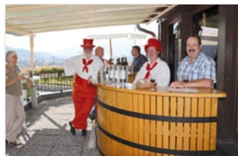
La Commune d'Yverne