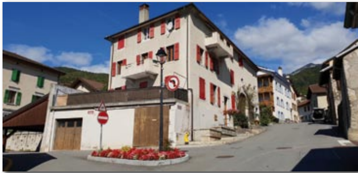
La circulation sous l'école et l'église se fait désormais en sens unique

est toutefois libre de 19h00 à 08h00 et durant les week-ends (une personne qui se gare à 18h31 pourra rester jusqu'à 08h00, le conducteur indiquant 19h00 comme heure d'arrivée sur le disque de stationnement).