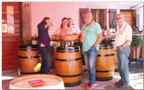
La Pierre Latine