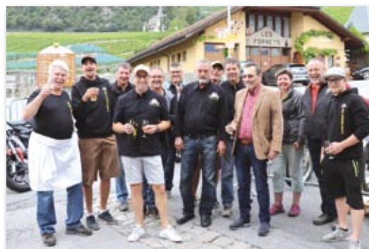
Les anciens et actuels membres du comité