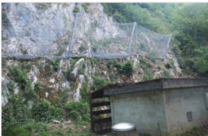
Filet terminé, captage protégé