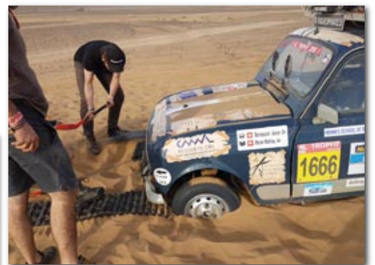
Les pannes et les mésaventures ne manquent pas durant une telle épreuve.