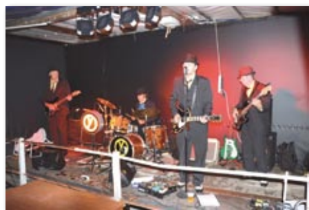
Les Yellow Dogs, excellents comme d'habitude

Les pompiers du SDIS en démonstration pour une désincarcération d'une voiture accidentée