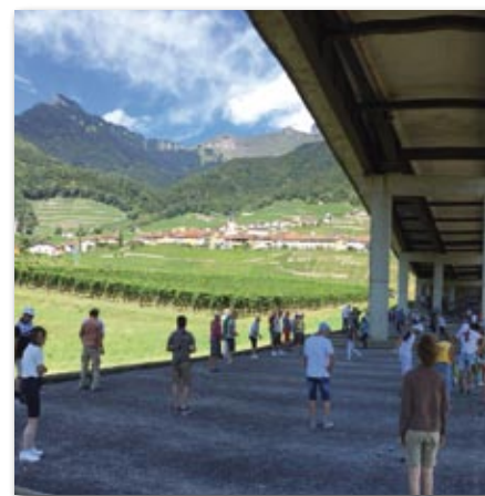
Des terrains supplémentaires ont été aménagés sous le pont