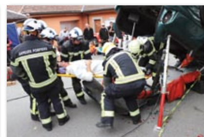
Les pompiers à l'œuvre