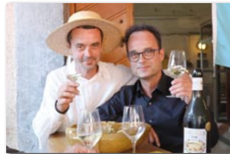
Domaine de l'Ouille