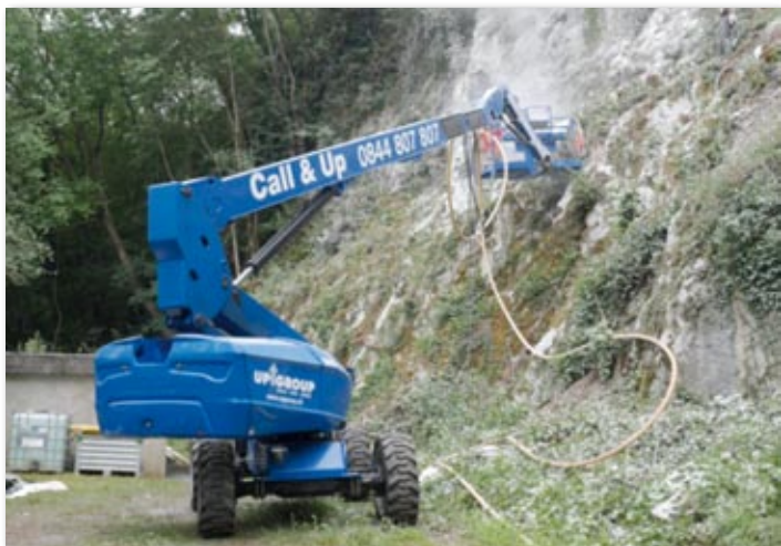
Forage à partir d'une nacelle

Le coût total s'élève à Fr. 73'523.-, duquel 70% est déductible à titre de subvention cantonale pour des travaux de protection contre les dangers naturels.