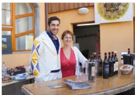
La Maison Blanche en famille