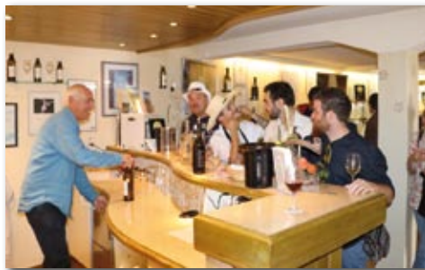
Les Artisans Vignerons d'Yverne