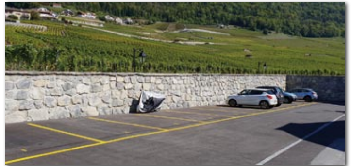
Le nouveau parking de Vers la Cour dispose de 12 places

Nous comptons sur chacun pour le respect de ces dispositions voulues (des contrôles seront effectués le cas échéant) afin d'amener de la sécurité tout en considérant l'aspect convivial de ce quartier et l'équité entre les citoyens.