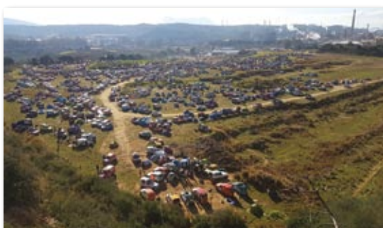
Près de 1300 équipages au bivouac

Nous remercions les employés communaux pour l'entretien des massifs publics ainsi que les villageois qui embellissent la commune.