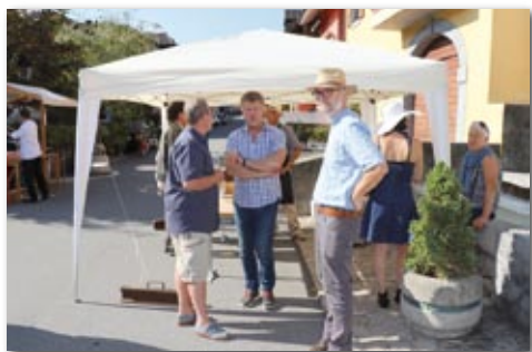
Le Clos de la George