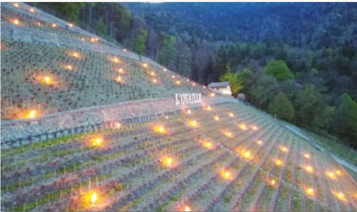
180 «chaufferettes» à base de paraffine ont été allumées à L'Ovaille pour protéger les ceps

Si, dans de la majorité du vignoble, cette température a été à la limite du gel, dans les hauts et les bas, particulièrement dans les bassières, le froid a été fatal pour les jeunes pousses. Un phénomène accentué dans les cultures basses et les remplacements, proches du sol. Géographiquement, les bas des Tannes, de Champ-Rogier, de La George, des Glariers et de Soccettaz ont été touchés ainsi que les hauts de vignoble comme l'Ovaille partiellement.