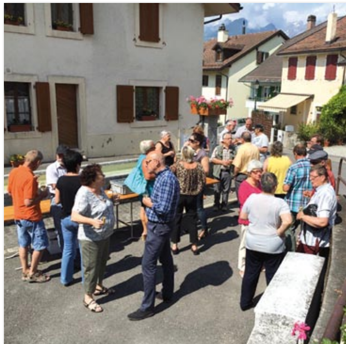
Le dernier «extra-muros» a eu lieu le 31 mai dernier dans le quartier des Rennauds

La Municipalité marque ainsi sa volonté de rester proche de la population, à son écoute et de répondre aux préoccupations et attentes de chacun. La prochaine rencontre aura lieu le 29 novembre à Versvey.