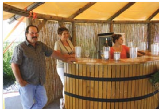
Domaine de la Commune: c'est top tôt!