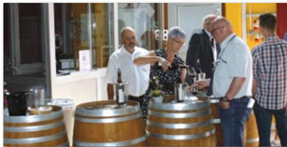
Chez les Artisans Vignerons d'Yverne

A Yverne, de vieux tracteurs rutilants avaient pris possession des lieux pour conférer une note d'histoire et d'authenticité à cette manifestation. S'il faut saluer le travail de toutes celles et ceux qui œuvrent à la parfaite organisation de ces caves ouvertes dans notre commune, afin d'accueillir nos hôtes d'un week-end dans les meilleures conditions, force est de constater qu'en dépit des efforts déployés et de la qualité de nos vins, la fréquentation a semblé faire défaut. Du monde ici ou là dans les différentes caves sans pour autant afficher les grosses affluences d'il y a quelques années, et des rues plutôt désertes, sans parler de la place du Caveau et ses longues tablées désespérément vides. Le concept doit-il être revu ? L'heure est à la réflexion.