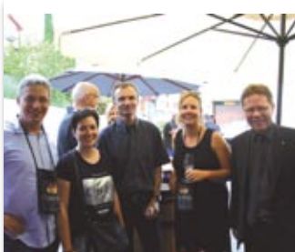
Des têtes connues!