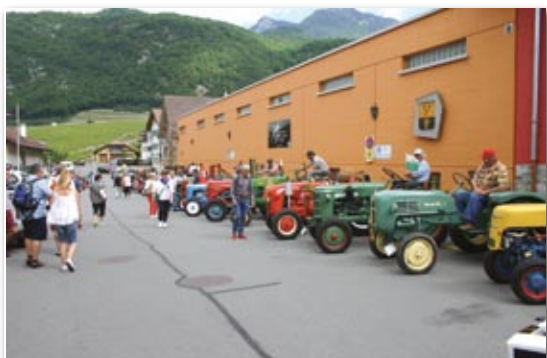
L'animation: les anciens tracteurs