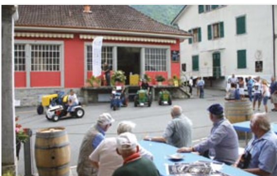
Le défilé depuis le Domaine de l'Ouille