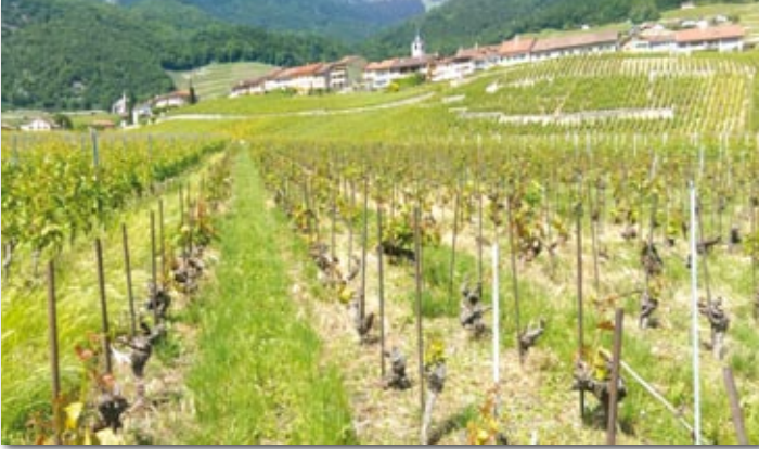
Le bas du vignoble a particulièrement souffert du gel

Après un mois de mars amplement doux, et avant les célèbres Saints de Glace de mai, plusieurs nuits glaciales ont tenu les vignerons vuarnéens en alerte. Durant les nuits du 18 au 21 et du 27 au 29 avril, le thermomètre a affiché des températures bien en dessous de 0°C.