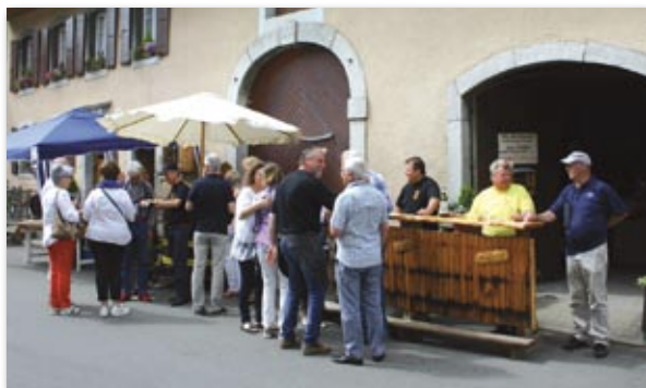
Cave Bibi Perréaz