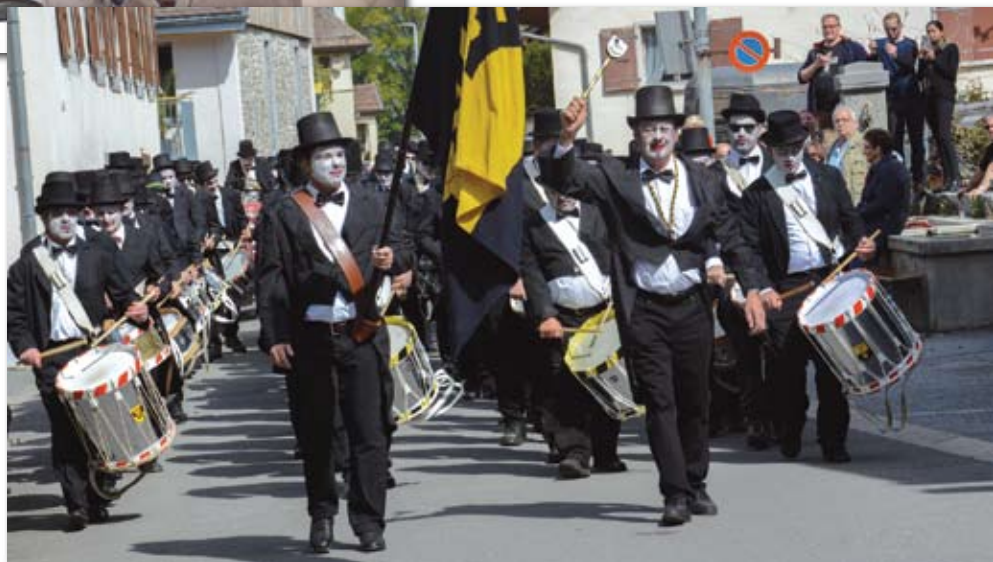
Le départ à Versvey