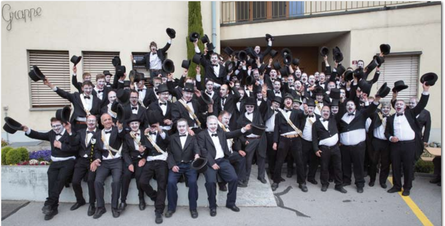
A la partie officielle à la Grappe