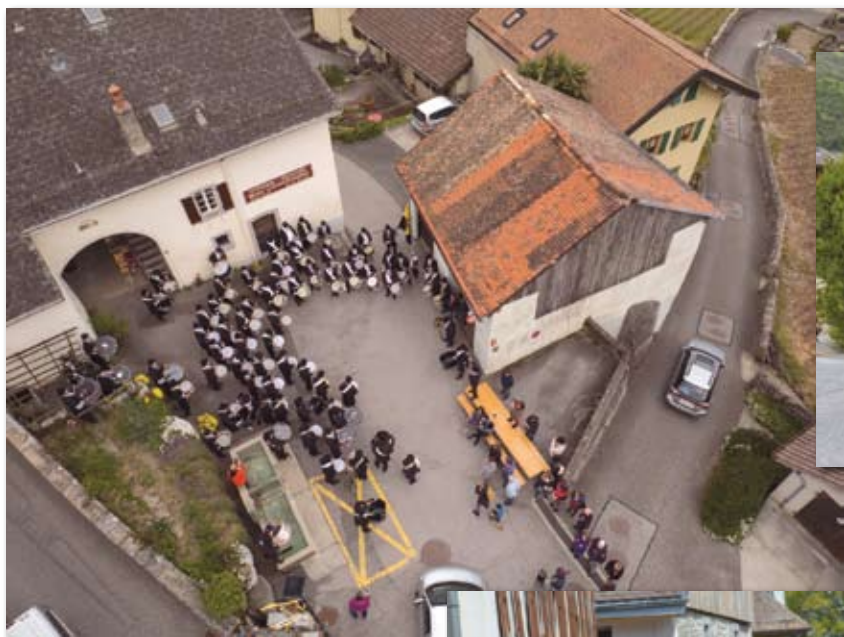
A l'arrêt de Vers-Morey