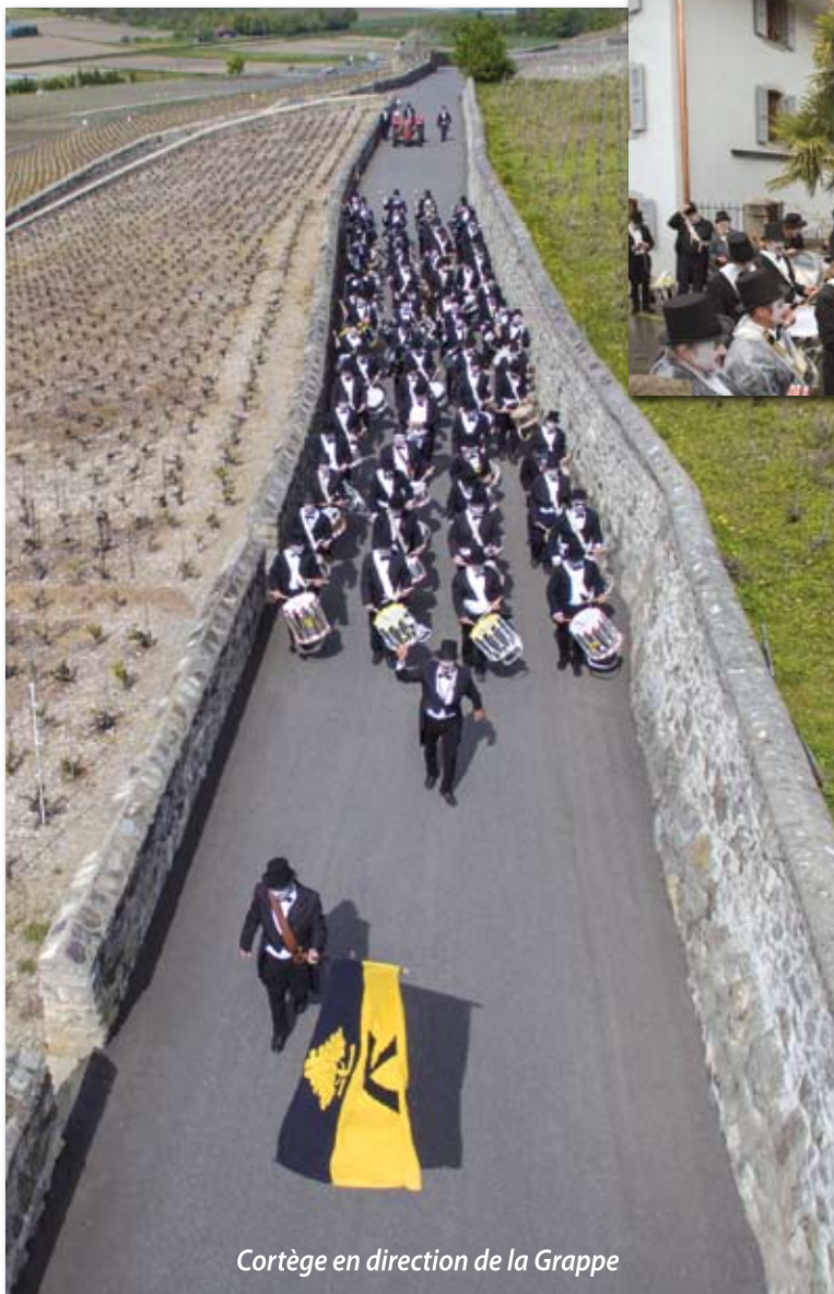
Cortège en direction de la Grappe