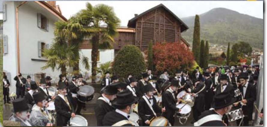
Devant l'arrêt des Rennauds