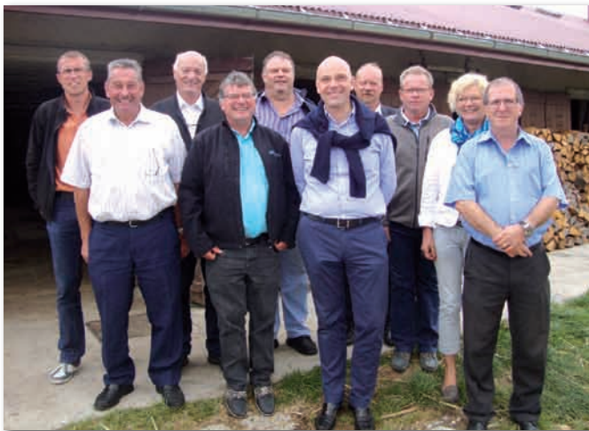
Les Bayets ont réservé un accueil des plus chaleureux à la Municipalité d'Yvorne

Yvorne et L'Abbaye entretiennent de régulières et cordiales relations. Chaque année les autorités de l'Abbaye viennent à Yvorne pour couper la première grappe de raisin du Clos de l'Abbaye, ainsi nommé en l'honneur du jumelage initié en 1975 pour des raisons alphabétiques, L'Abbaye étant la première commune du canton et Yvorne, la dernière.