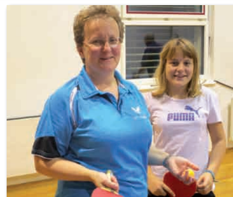
Mère-fille... la relève...

Pour tout renseignement, vous pouvez vous adresser à Alex Cropt 079 317 95 07 ou à Isabelle Derégis 079 302 45 32