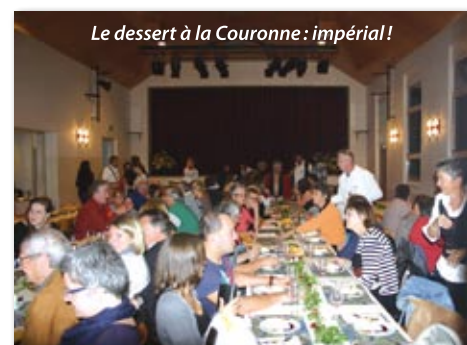
Le dessert à la Couronne : impérial!