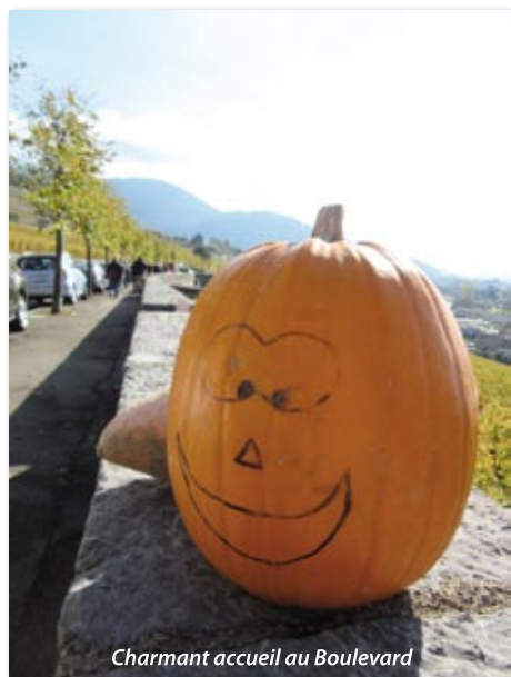
Charmant accueil au Boulevard

10h15, église du Cloître à Aigle Paroisse