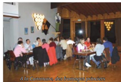
A la Commune, des fromages princiers