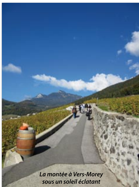
La montée à Vers-Morey sous un soleil éclatant