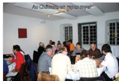
Au Château, un repas royal