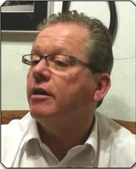
Michel Dubuis Municipal

Un changement de comportement et financier important pour les ménages. La transition s'est-elle faite dans de bonnes conditions?