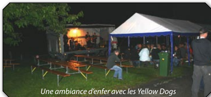
Une ambiance d'enfer avec les Yellow Dogs