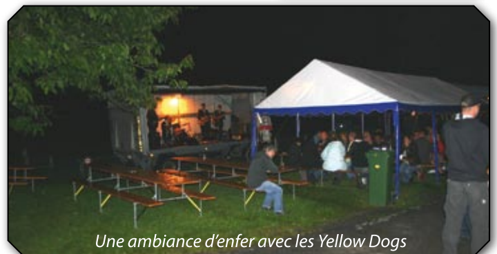
Une ambiance d'enfer avec les Yellow Dogs