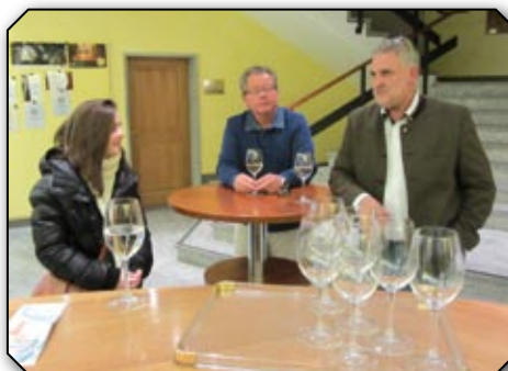
L'ensemble des participants, dont la Municipalité in corpore,