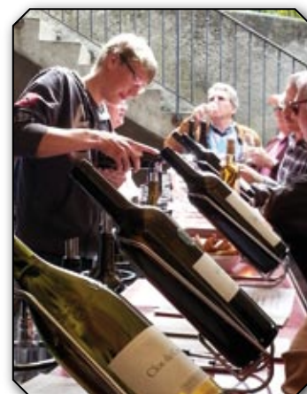
L'art de mettre tous les sens en éveil au Domaine de la Pierre Latine