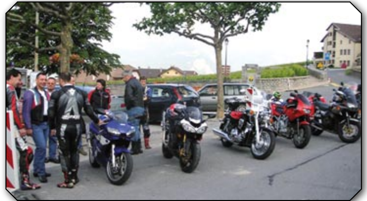
Les motards prêts au départ sur la place du Torrent