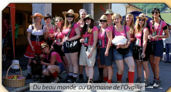
Du beau monde au Domaine de l'Ouille