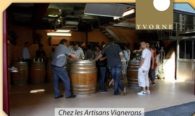
Chez les Artisans Vignerons