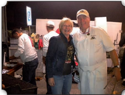
Remise du Mérite Vuarnéran

Décembre verra les traditionnelles fenêtres de l'Avent au cours desquelles nous nous réjouissons de vous croiser nombreux. Comme en 2003 et 2004 le premier week-end de décembre se placera sous le signe de la Marche de l'Espoir durant 24 h lors du 25 ème Téléthon.