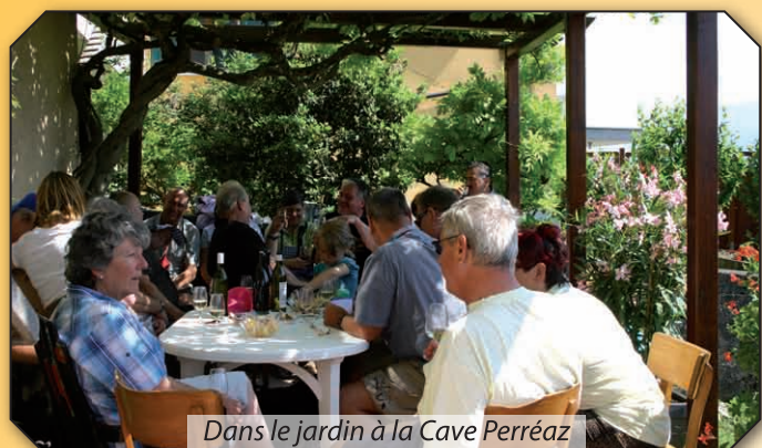
Dans le jardin à la Cave Perréaz

Les traditionnelles Caves Ouvertes se sont déroulées les 26 et 27 mai sous un soleil généreux. Elles ont eu lieu simultanément avec les Caves Ouvertes du canton de Vaud. 1'500 verres ont été vendus pour déguster cet exceptionnel millésime 2011. Une belle affluence de connaisseurs des vins de notre commune.