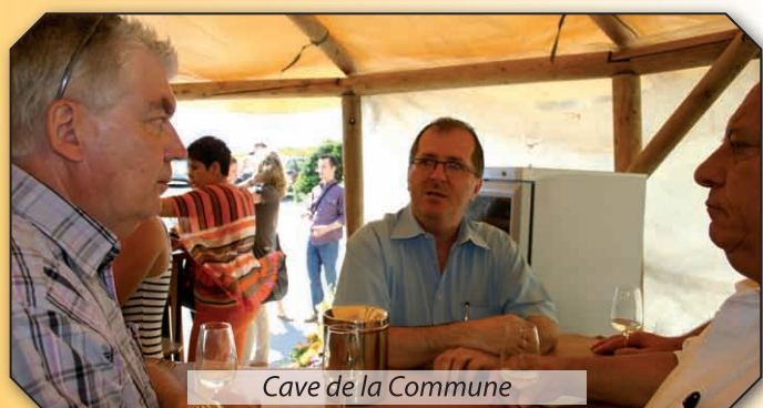
Cave de la Commune