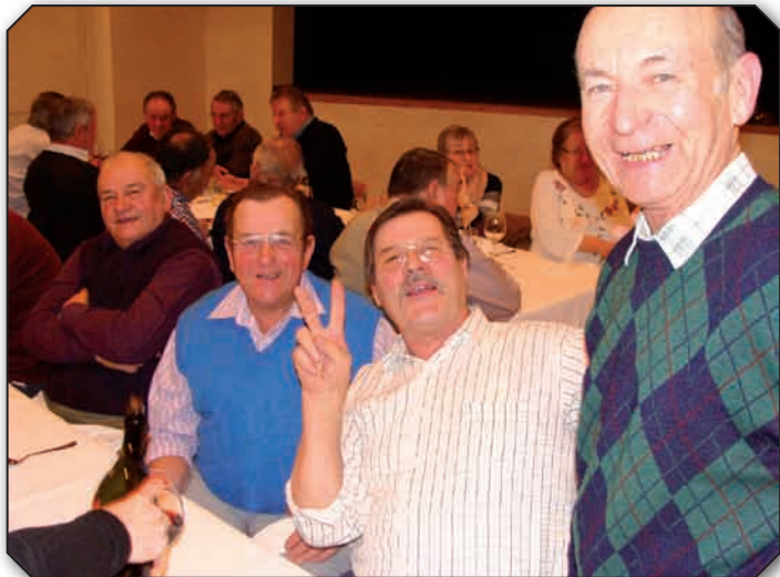
La joie et la bonne humeur règnent au sein des aînés de notre commune

Le traditionnel Noël des Aînés, organisé par la Commune, a eu lieu le 15 décembre 2011 à la Grande salle de la Couronne et a réuni plus d'une centaine de participants. Les Municipaux ont assuré le service du repas qui a enchanté les papilles des convives présents.