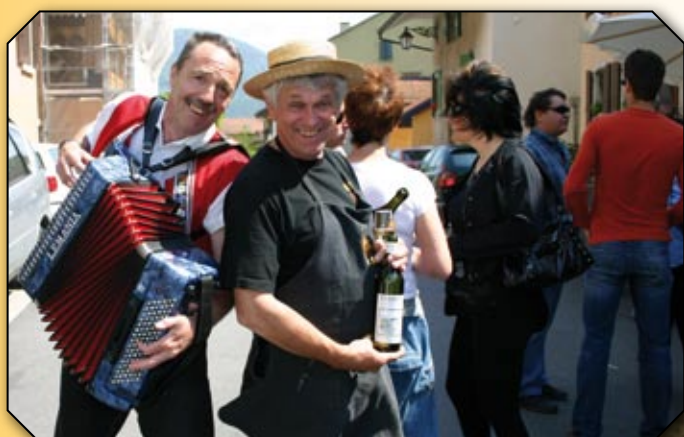
Ambiance garantie à la Cave Perréaz