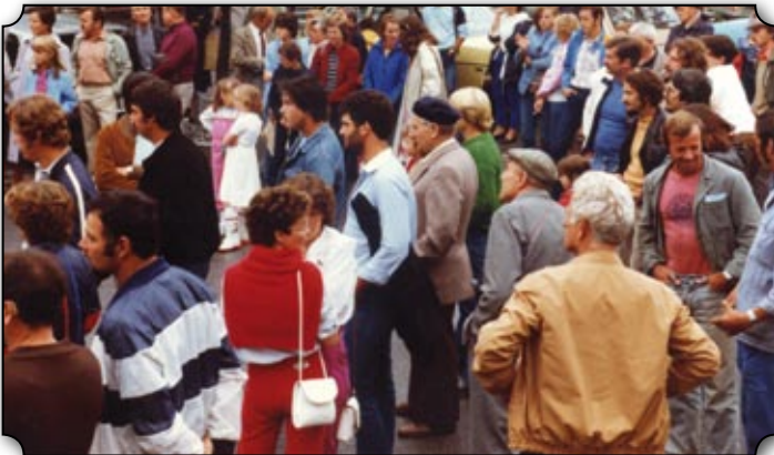
Des têtes connues au discours...