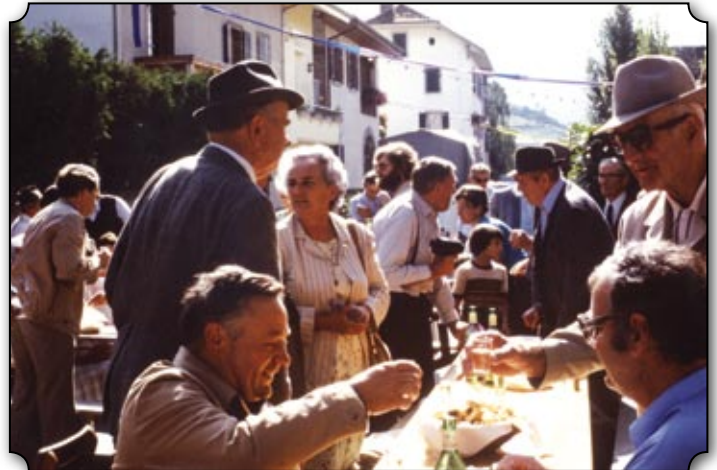
Des têtes connues à table...