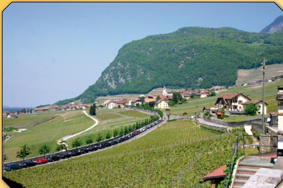
Du monde sur le parking du Boulevard avec le Domaine des Portes Rouges

Les traditionnelles Caves Ouvertes se sont déroulées les 22 et 23 mai sous un soleil généreux. Elles ont eu lieu simultanément avec les Caves Ouvertes du canton de Vaud. 1'500 verres ont été vendus pour déguster cet exceptionnel millésime 2009. Une belle affluence de connaisseurs des vins de notre commune.