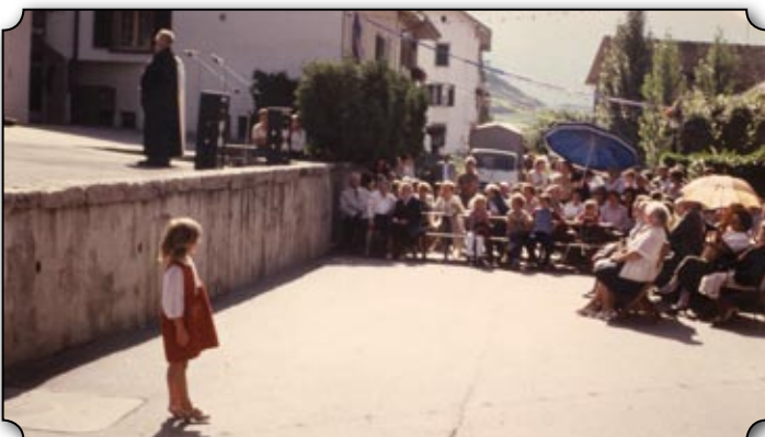
Le traditionnel culte du dimanche matin