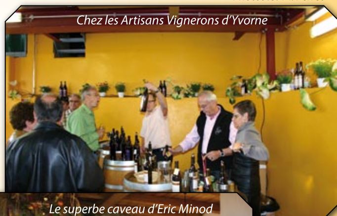
Chez les Artisans Vignerons d'Yvorne