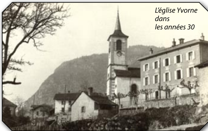
L'église Yvorne dans les années 30