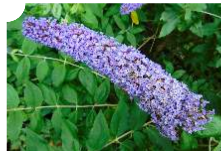
Buddléia de David

La lutte contre les plantes exotiques envahissantes nécessite dès lors une collaboration étroite entre les autorités communales, cantonales et les citoyens pour préserver la biodiversité et la qualité des écosystèmes locaux.