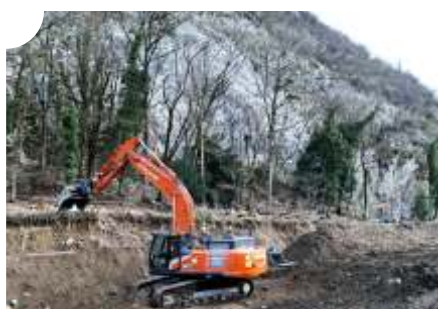
Le bois issu du défrichage sera réutilisé dans des projets locaux, contribuant ainsi à une gestion durable des ressources.