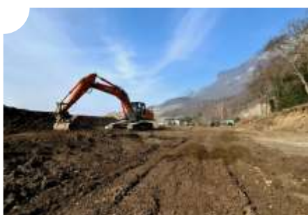
Près de 13'000 m 2 de forêts et lisières ont été défrichés.

La météo capricieuse de janvier n'a pas empêché les travaux de terrassement de se poursuivre : excavation jusqu'aux fonds de fouilles, préparation des sols pour la mise en place des enrochements. Les digues prennent forme peu à peu et les travaux devraient se poursuivre jusqu'à l'hiver prochain.