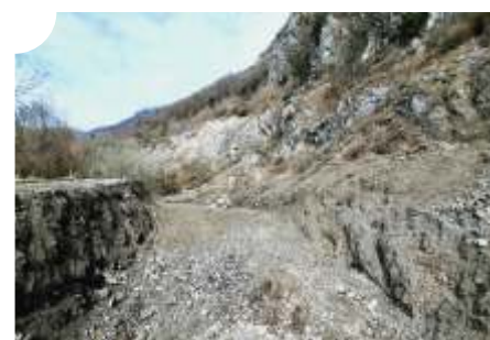
L'excavation et la préparation des sols se poursuivent, permettant aux digues de prendre forme progressivement.