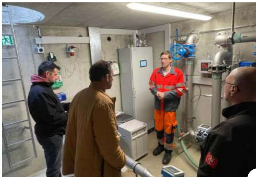
La Commission de gestion participe à des visites sur le terrain, comme récemment avec une présentation de la nouvelle chambre de chloration des sources des Joux et de Rouge Terre.