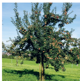
Arbre fruitier haute tige