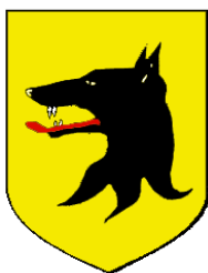
Commune de Corbeyrier